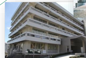
保健管理センター