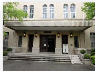
社会科学系図書館