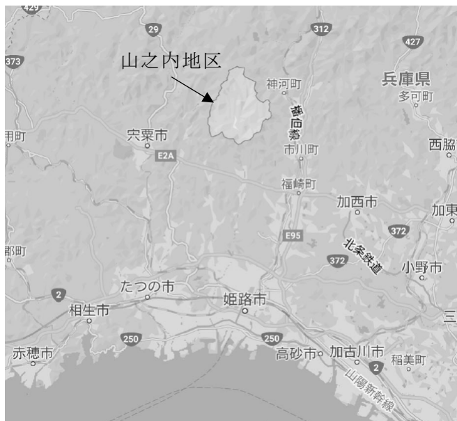
図1 兵庫県姫路市夢前町山之内の位置